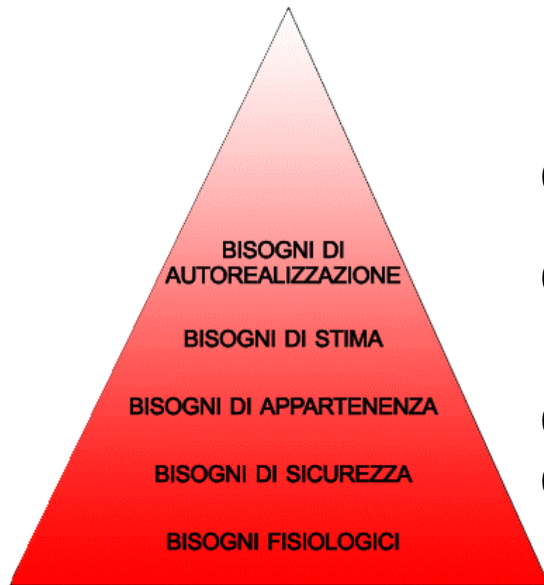
La piramide dei bisogni di Maslow (1954)

Il modello di Maslow è stato molto criticato: